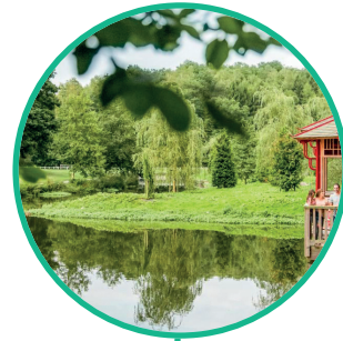
DOMAINE PROVINCIAL DE CHEVETOGNE