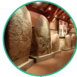
MUSÉE DES MÉGALITHES