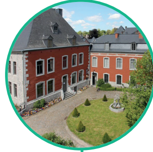
FAMENNE & ART MUSEUM

Grâce à sa situation et à sa facilité d'accès, la maison Véronique attire principalement des résidents de la région. Nous sommes situés dans un lieu vivant et profitons au maximum des atouts de la région. Nous partons dès lors régulièrement à la découverte de la nature ou nous balader dans les villages voisins. Nous combinons l'avantage de vivre dans le calme et la tranquillité, et la proximité immédiate de nombreux endroits intéressants.