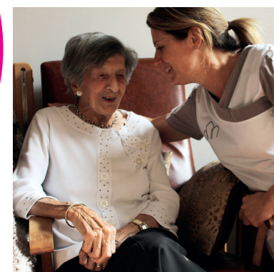
p.03: Een verblijf op maat