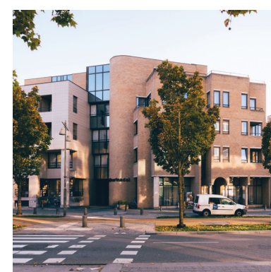
p.07: Bezoek ons