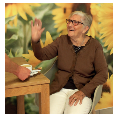
p.05: Wonen met toekomst