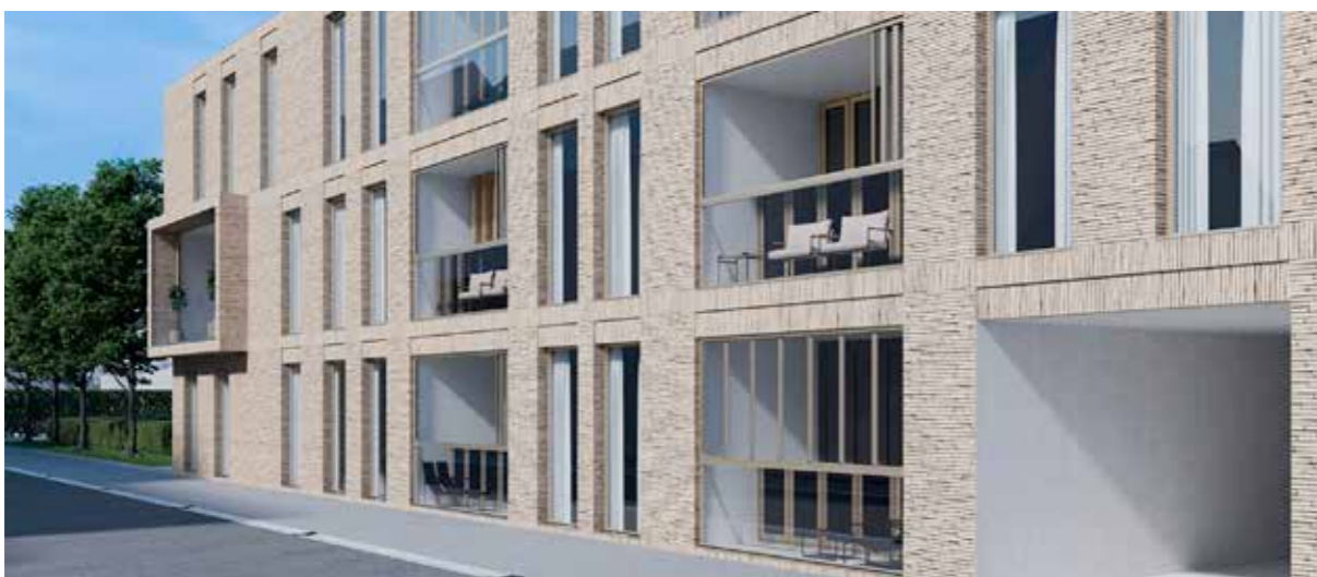
Foto Residentie Steen STEENOKKERZEEL