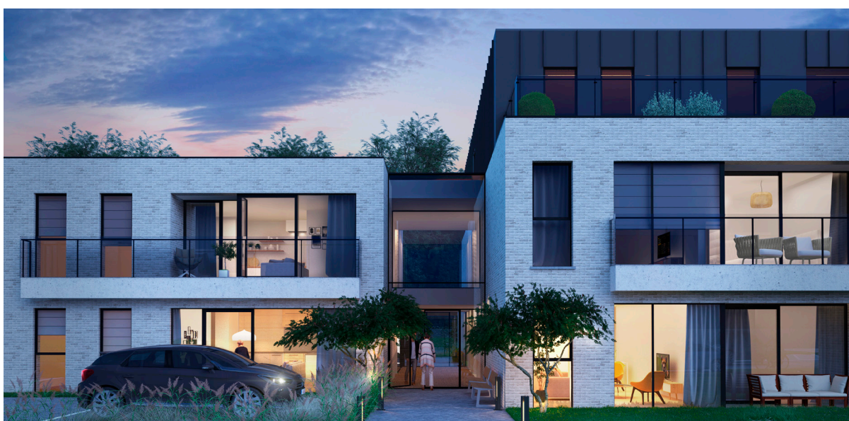
Foto Residentie De Veiling HOOGSTRATEN