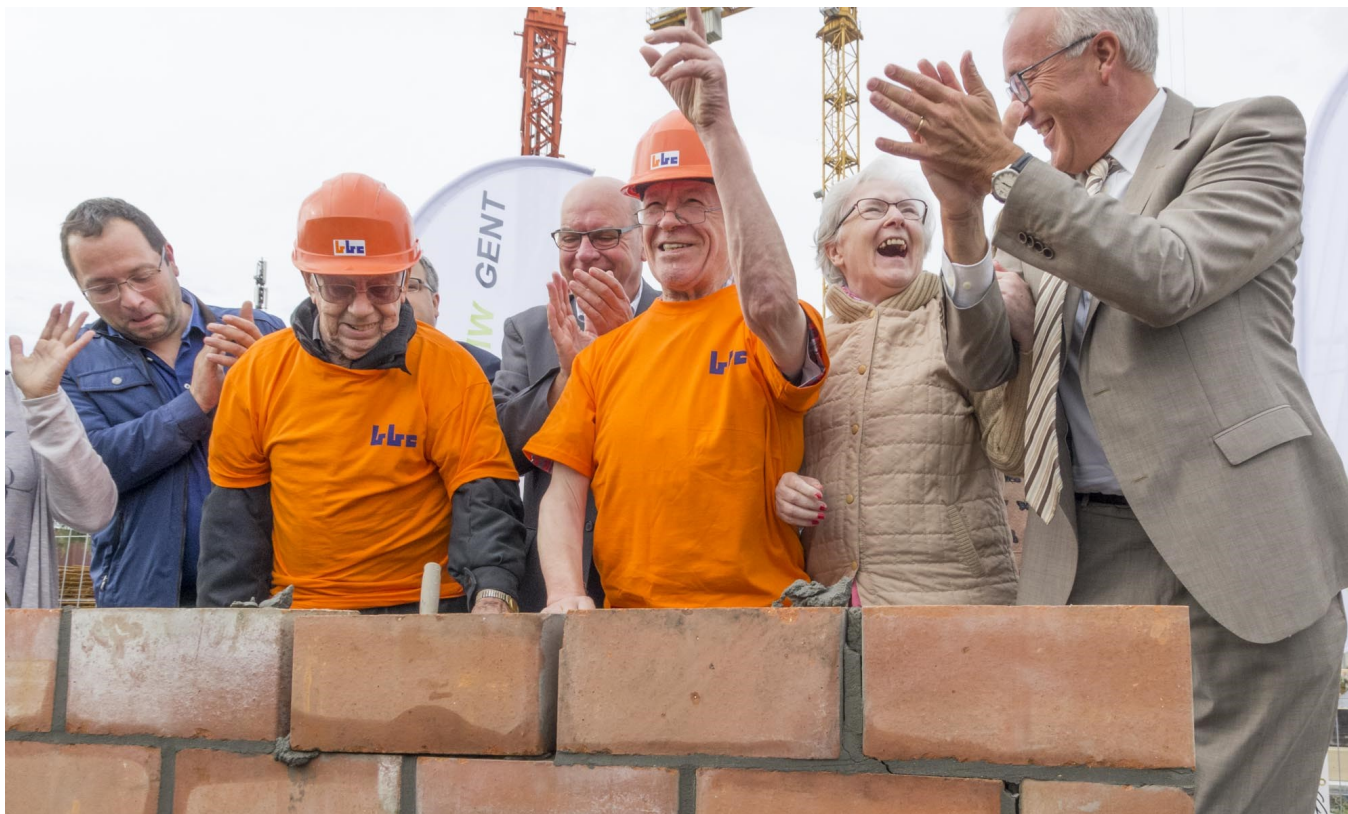
Bij de eerstesteenlegging van De Zonnetuin staken ook enkele bewoners van woonzorgcentrum Zonnebloem een handje toe