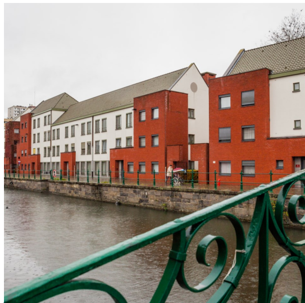
Assistentiewoningen Antoniushof aan de Antoniuskaai