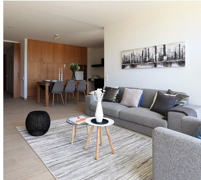
Assistentiewoningen De Zonnetuin in Zwijnaarde