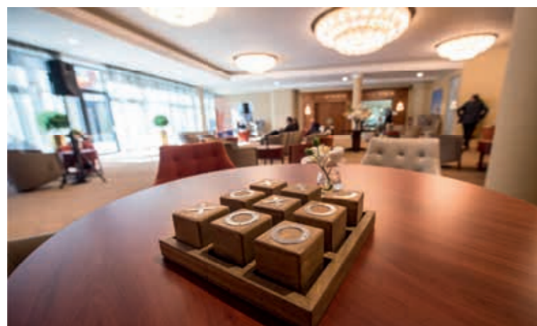
Park Lane ★★★★★ Woonzorgcentrum