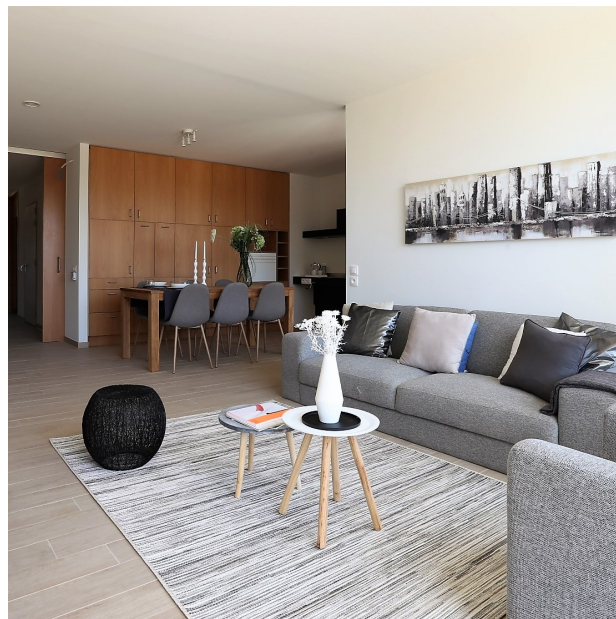
Assistentiewoningen De Zonnetuin in Zwijnaarde